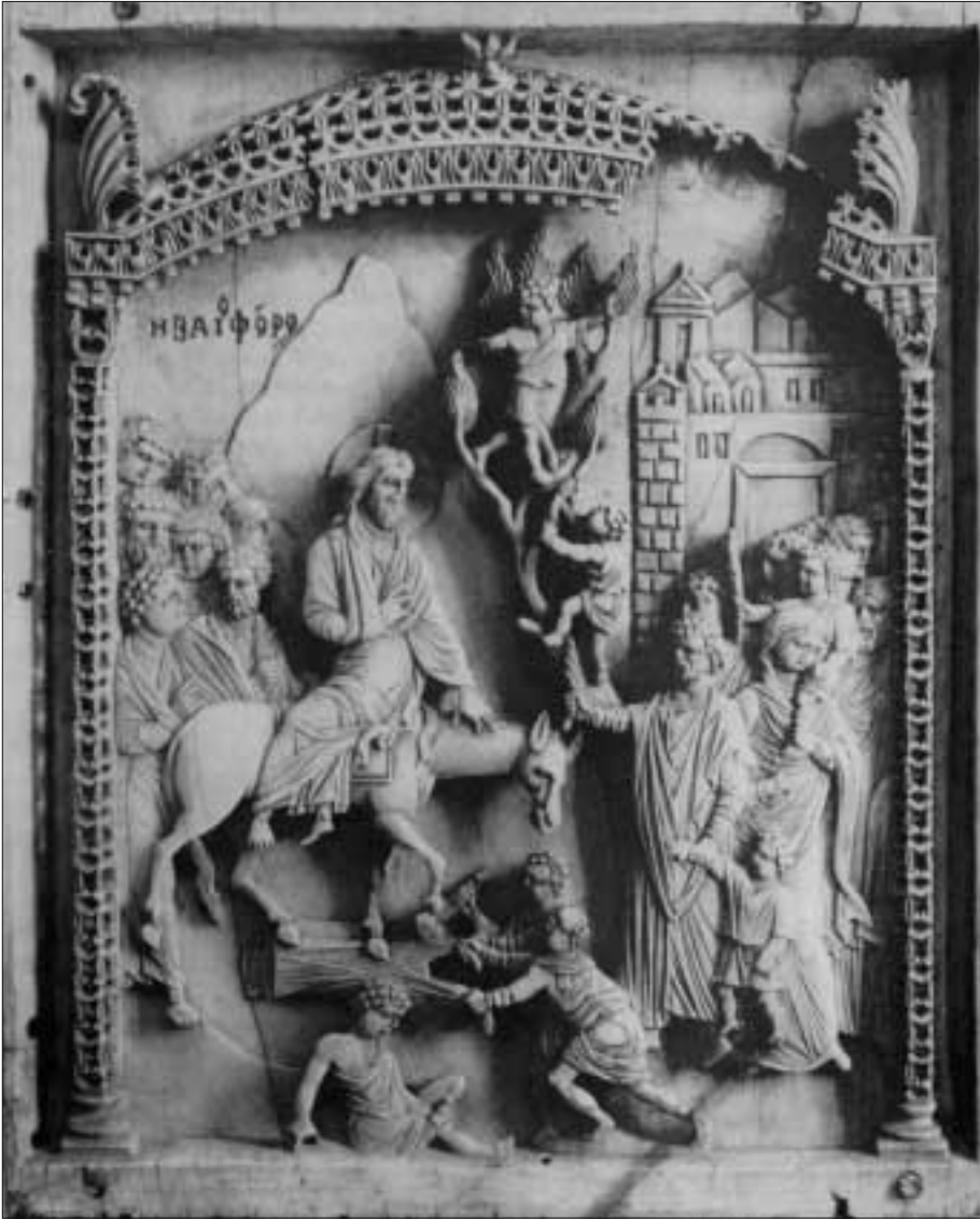
Abb. 3: Wer zieht in welche Stadt ein? Jesus Christus in die heilige Stadt Jerusalem? Oder Kaiser Andronikos in die Byzantinische Hauptstadt Konstantinopel?

des Tuchs sogar in der ersten Hälfte des zweiten „christlichen“ Millenniums nicht zur katholischen Tradition. Nur ziemlich spät begannen einzelne Maler (nicht die Kirche), das Grabtuch abzubilden. Dafür aber war die Verehrung des Grabtuchs in der orthodoxen Kirche seit Anfang des 13. Jahrhunderts sehr verbreitet. Man bildete das Grabtuch, so gefaltet, dass die Abbildung des Jesusgesichts oben lag und sichtbar war, als eine Ikone ab. Diese Ikone hieß Spas (der Erlöser) und trug das Attribut „archoiropoietisch“ (genauer: nicht von Menschenhand geschaffen). Diese Ikonen waren sehr verbreitet, somit deuten sie auf einen längeren Aufenthalt der Reliquie in Russland hin, wo das Gesicht Jesu dann von den russischen Malern auf den Spas-Ikonen abgebildet wurde.