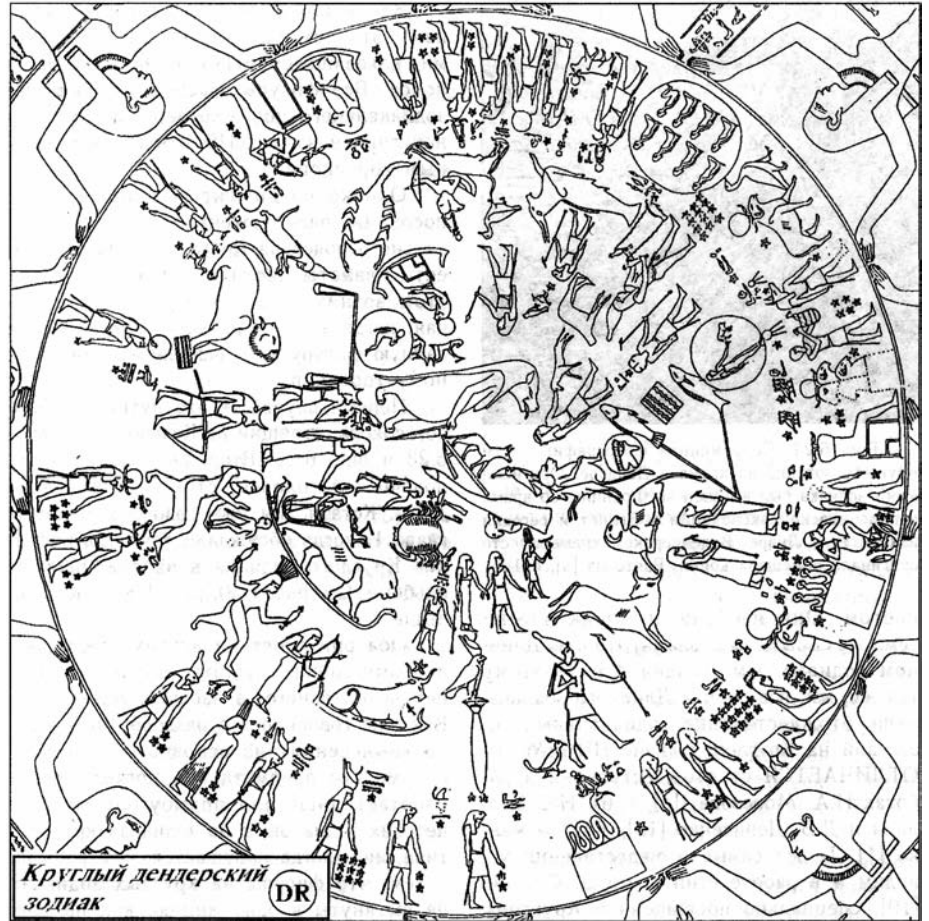
Abb. 4: Das runde Dendera-Horoskop. Eine grafische Darstellung nach einer fotografischen Vorlage. Ein Horoskop zeigt nicht nur die Tierkreis-Sternbilder, sondern auch die Positionen von Sonne, Mond und fünf Planeten (Merkur, Venus, Mars, Jupiter und Saturn) in den Sternbildern. Dieser Horoskop wurde durch Fomenko und Nossowski in das Jahr 1185 datiert.

Zu der Datierung von Horoskopen muss ich noch folgendes sagen. In ihren zahlreichen Büchern haben F&N insgesamt 26 Horoskope datiert. Das sind alle Horoskope, die sie aus historischen Quellen in Ägypten, Türkei und in Europa gewinnen konnten. Und alle