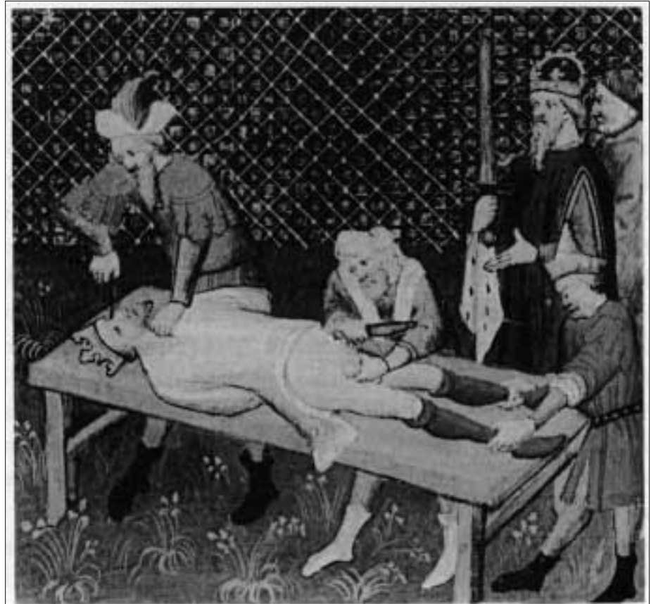
Abendländische Darstellung der Wirren in Byzanz am Vorabend des 4. Kreuzzugs: 1185 wird Andronikos I. Komnenos von seinen Untertanen auf gräßliche Weise umgebracht (Miniatur aus dem Decamerone des Boccaccio, Bibliothèque nationale, Paris).

Nach der Tradition des 15. Jahrhunderts müssten wir für die Suche nach dem Geburtsjahr Jesu die Jahre 1250, 1200, 1150 etc. betrachten. Man sieht, dass sich die beiden Zahlenreihen zum ersten Male im Jahr 1150 kreuzen. Das wäre also die wahrscheinlichste Lösung bei der Suche nach dem Geburtsjahr Jesu. Es ist kaum anzunehmen, dass man 1300 Jahre wartete, um endlich anzufangen, die Jubeljahre nach Christi Geburt zu feiern. Das Jahr 1150 liegt