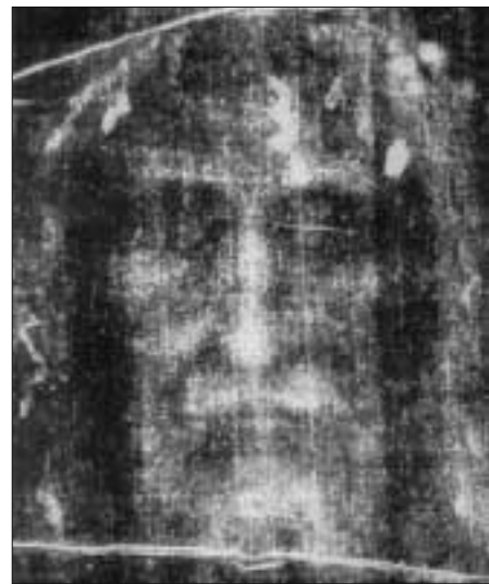
Abb. 2: Gesichtsabdruck auf dem Turiner Grabtuch. Jesus? Kaiser Andronikos I. Komnenos (1182-1185)? Oder eine künstlerische Phantasie?

E. Halley berechnete 1705 die Bahnen von mehreren Kometen und zeigte, dass die besonders hellen Kometen, die 1531, 1607 und 1682 beobachtet wurden, ein und denselben, also einen periodischen Kometen darstellen. Seine Voraussage für das Jahr 1758 für die Wiederkehr dieses Kometen wurde nach einer Korrektur durch Berücksichtigung der Störungen durch die Planeten in das Jahr 1759 verlegt und durch das Erscheinen des Kometen bestätigt. Daraus ergibt sich eine Periode von rund 76 Jahren. Eine Rückberechnung