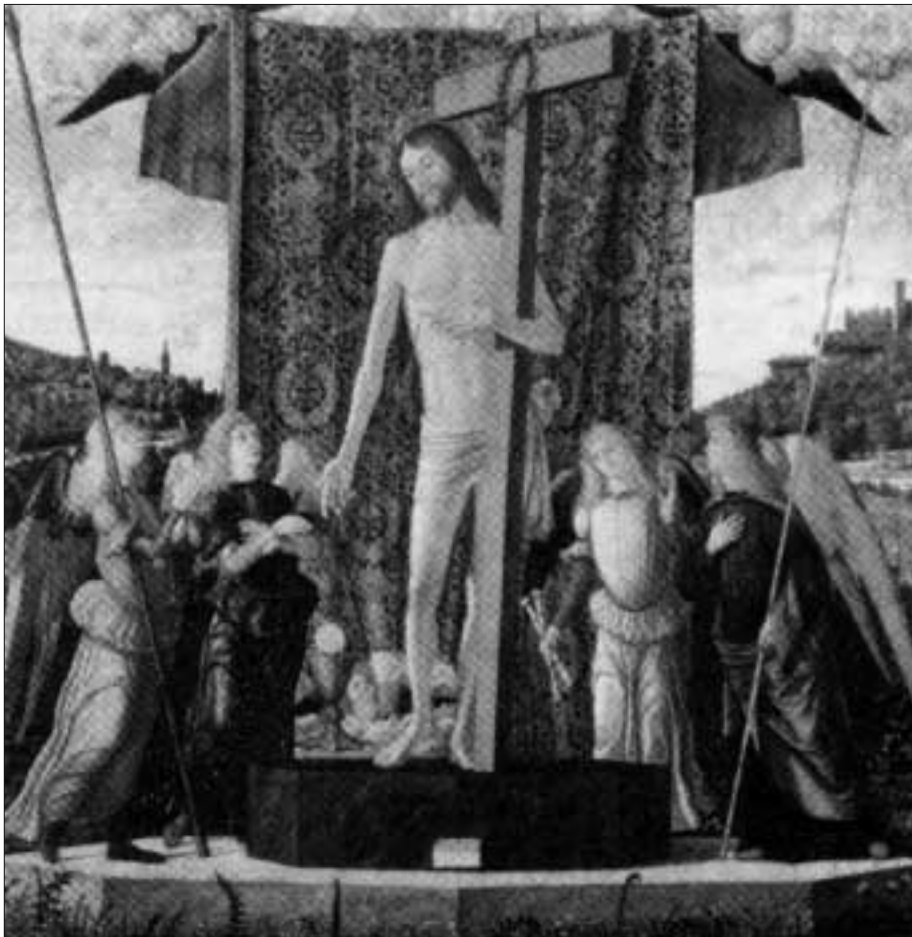
Abb. 6: Jesus Christus mit Engeln. Ein Bild von Vittore Carpaccio. Angeblich 15. Jahrhundert. Zwei Engel halten die Peinigungsutensilien, die man normalerweise in den Händen der Römer zu sehen gewohnt ist: die Pike und den Stock mit Essigschwamm. Waren die Engel (Angelo) unter den Peinigern von Jesus?

Zahlen nicht beherrschte und keine Ziffern, sondern nur Buchstaben für die Notierung der Zahlen benutzte. Auf jeden Fall hat man solche Bezeichnung der Jahre noch im 14.-16. Jahrhundert breit benutzt. Im 17. Jahrhundert begann man die arabischen Ziffern zu verwenden und die alte komplizierte Aufzeichnung der Jahreszahlen wurde langsam vergessen. Darum entstanden bei den Abschriften der alten Paleja-Bücher und -Manuskripten Fehler, die nicht immer erlauben, ein altes Datum ganz eindeutig zu bestimmen. In solchen Fällen muss man heute mehrere Varianten untersuchen.