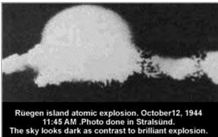
Rügen island atomic explosion. October 12, 1944 11:45 AM .Photo done in Stralsund. The sky looks dark as contrast to brilliant explosion.

Die SD-Strukturen sind nach dem Krieg erhalten geblieben. Die Schweigegelübde wurden eingehalten. Die Stolleneingänge wurden noch bis Ende der 90er Jahre regelmäßig kontrolliert, beobachtet und bewacht. Die Kontakte zu den örtlichen Bewachern und deren Bezahlung liefen über die Leipziger Messe.