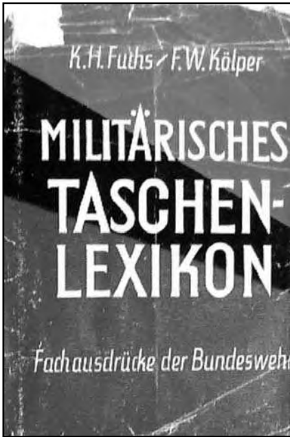
Abb. 1: Umschlag „Militärisches Taschenlexikon“

Wer über deutsche Flugscheiben oder UFOs schreibt wird belächelt und als Spinner dargestellt.