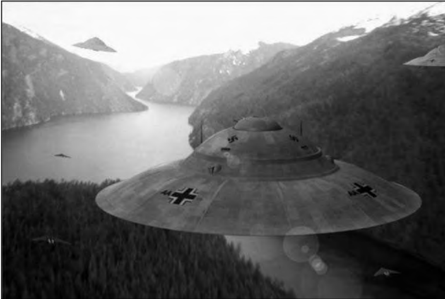
So könnten die deutschen Flugscheiben ausgesehen haben (Computer-Rekonstruktion)

MST hat selber gesehen, wie immer wieder Zeichen in der Landschaft erneuert wurden. Die Aktivitäten seitens der SD-Strukturen gingen von der BRD vom Bodenseeraum aus.