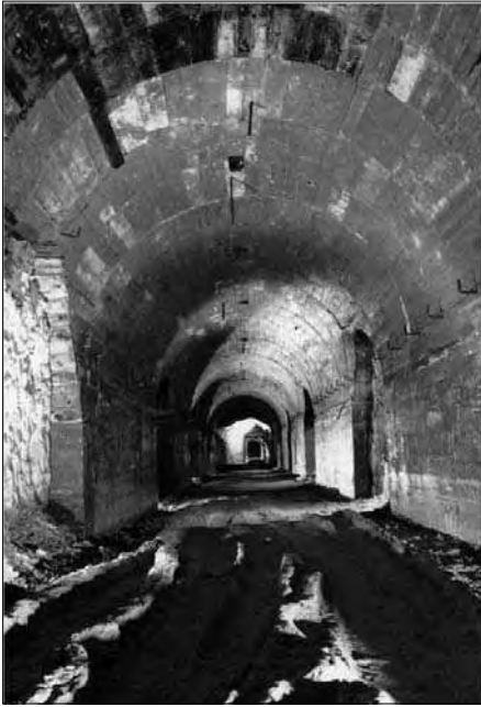
Blick in einen der Stollen im Jonastal.

die Explosionsstelle zugeschüttet und mit Erde überdeckt. Es ist daher nicht verwunderlich, dass Erdproben von der Oberfläche, die jetzt gezogen wurden, keine eindeutigen Beweise für eine Kernwaffenexplosion lieferten.