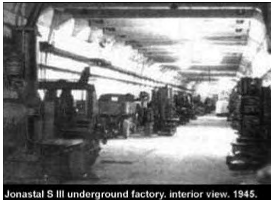
Jonastal S III underground factory. interior view. 1945.

Flugscheiben griffen sporadisch in das Kriegsgeschehen ein, aber selten und unbemerkt. Ein solcher Fall war der Angriff alliierter Bomber auf Leuna am 12./13. März 1945. Der deutschen Flak wurde befohlen, nicht zu schießen. Viele Bomber wurden trotzdem vernichtet. Flak-Leute berichteten später verstört, dass die Bombenteile nur so vom Himmel fielen, obwohl keiner von ihnen einen Schuss abgegeben hatte.