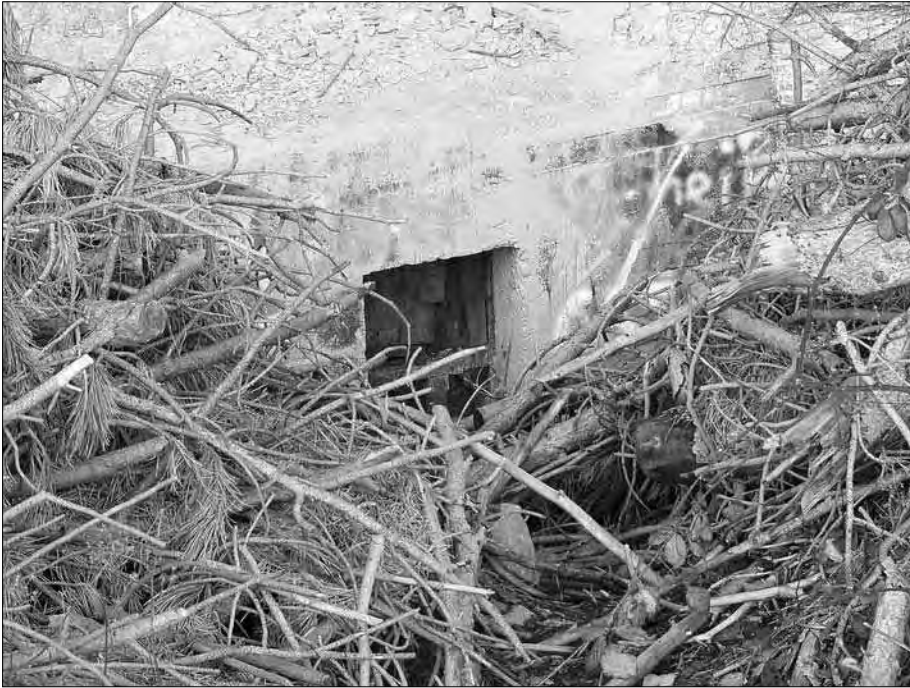
Vermauerter Stolleneingang im Jonastal.