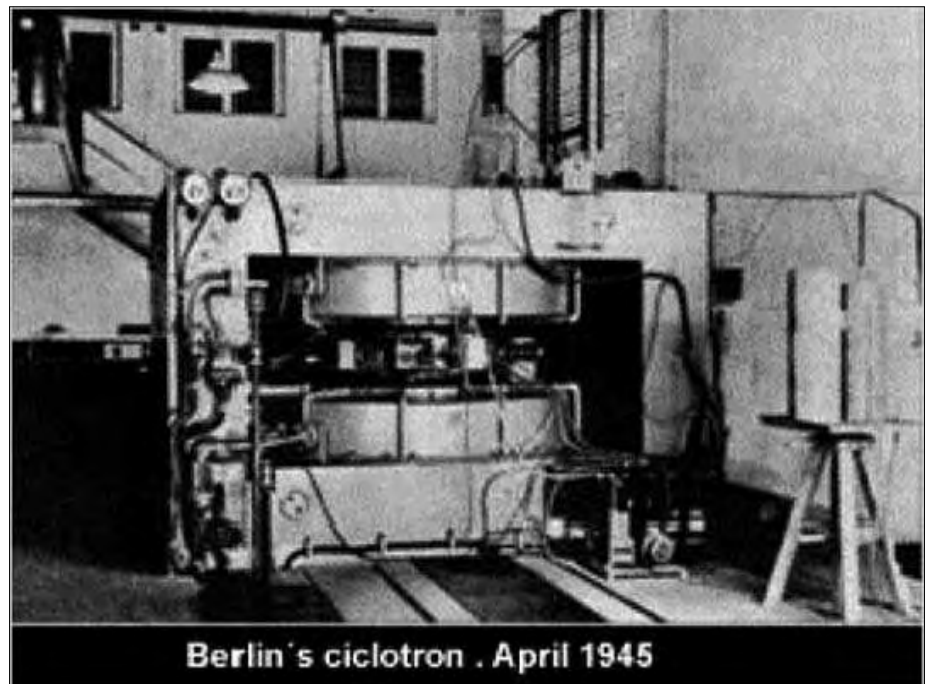
Berlin's cyclotron . April 1945

Laut MST war der Entscheidungsträger für den Einsatz der Siegeswaffen Albert Speer. Der jedoch, und Gleichgesinnte, verweigerten die Freigabe. Begründung war, dass man Hitler für einen Dilettanten hielt. Der hat den Krieg viel zu früh begonnen. 1943/44 waren die Rüstungsbetriebe erst soweit, die entscheidenden Waffen und Kampfmittel zu produzieren. Speer und Anderen war schon frühzeitig klar gewesen, dass der