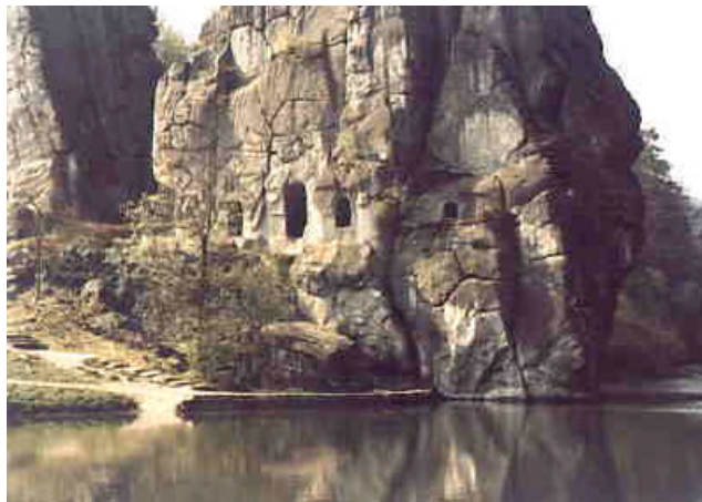
Die Externsteine, Fels 1: ganz rechts in der Bildmitte die „Reklusenzelle“. Links daneben die Hauptgrotte mit ihren Zugängen.

Die Externsteine sind ein sagenumwobenes Monument, eine riesige Steinreihe, die in der Nähe von Horn-Bad Meinberg (bei Paderborn) in den Himmel ragt. Die Formation dieser Steine ist jedoch nicht einzigartig, so imposant sie auch auf den Besucher wirken. Südwestlich in etwa vier Kilometern Luftlinie befinden sich die sehr ähnlichen Klippen der Velmerstot. Weiter im Süden die Teutoniaklippen, und noch südlicher, bereits im Altkreis Brilon (jetzt Hochsauerlandkreis), das „Felsen- und Klippenmeer“ mit Opferstein und der Bergspitze „Nadel“, und die Bruchhauser Steine.