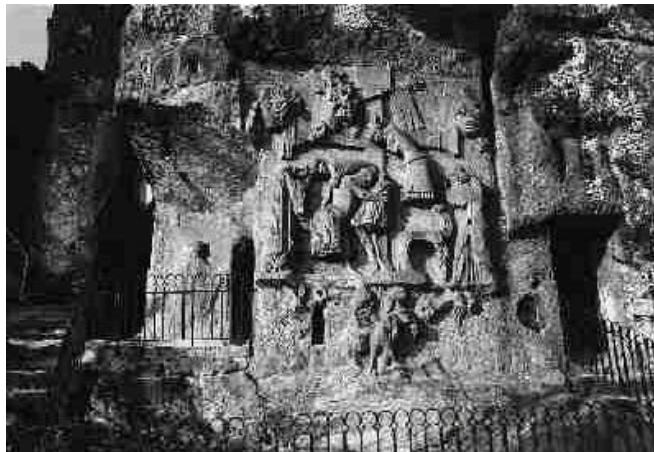
Das Externsteinrelief. Links davon das „Petrus-Relief“ mit dem Zugang zur „Petrus-Grotte“, rechts neben dem Relief der Zugang zur Hauptgrotte

Die Thesen, um was es sich bei den Externsteinen gehandelt hatte, gehen von einer Kultstätte - mal heidnisch, mal christlich - bis zu modernen Deutungen, es habe sich hierbei um ein prähistorisches Raumfahrtzentrum gehandelt. Alle Variationen sind vertreten, weil man eben nicht mehr weiß, was es wirklich war.