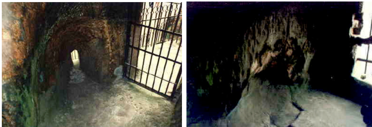
Linkes Bild: Der „Luftschacht“ gleich rechts neben dem Zugang zur „Petrusgrotte“. Er wurde benötigt, um in diesem Raum über einen längeren Zeitraum ein größeres Feuer unterhalten zu können. Rechtes Bild: Das „Mikrofonloch“ an der rechten Wand neben dem zweiten Zugang zur Hauptgrotte.

Es ist archäologisch erwiesen, dass in der Hallstatt/Latène-Zeit Feuerbestattungen stattfanden. Und wenn man bei der besonderen, exponierten Lage der Externsteine (inkl. Knickenhagen und Bärenstein) von einem „heiligen“ Bezirk sprechen möchte, dann setzt eine Brandbestattung auch eine Leichenverbrennung voraus. Genau das ist hier passiert.