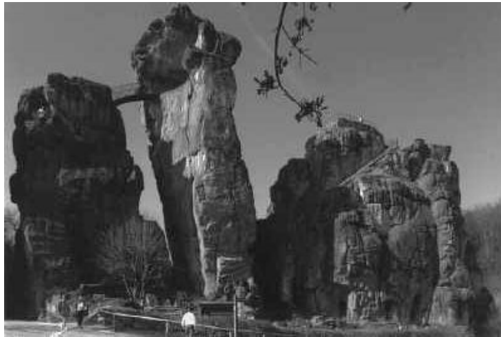
Die Externsteine: In der Bildmitte Fels 2 mit dem durch ein Brückchen erreichbares Sazellum.

wie eine Reihe weiterer „Figuren“ und „Gesichter“, die man hier und dort mit einiger Phantasie in den Felswänden erkennen kann.