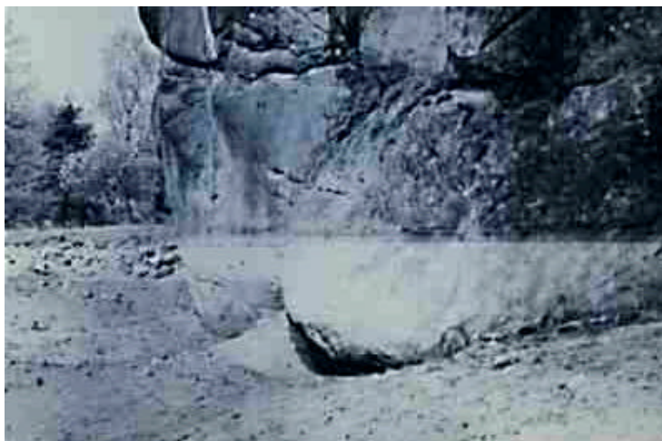
„Des Teufels Arschbacken“. Dieses Bild entstand 1934, als das Wasser des angestauten Sees abgelassen war. Deutlich erkennbar ist die Wasserstandslinie. Das Aschenloch befindet sich zwischen den beiden „Backen“.

Betrachtet man sich die Externsteingruppe von der westlichen Seite, so ist diese heute von einem nach dem zweiten Weltkrieg künstlich angestauten See des Baches Wiembeke umgeben. Dort befindet sich in Fels 1 das sogenannte „Teufelsloch“ oder, wie es richtig heißt: „Des Teufels Aschloch“. Es liegt heute unterhalb der Wasseroberfläche, weshalb wir uns fragten, ob der See nur deshalb angestaut worden ist, um dieses Merkmal zu vertuschen? Denn allein die Bezeichnung ließ uns aufhorchen.