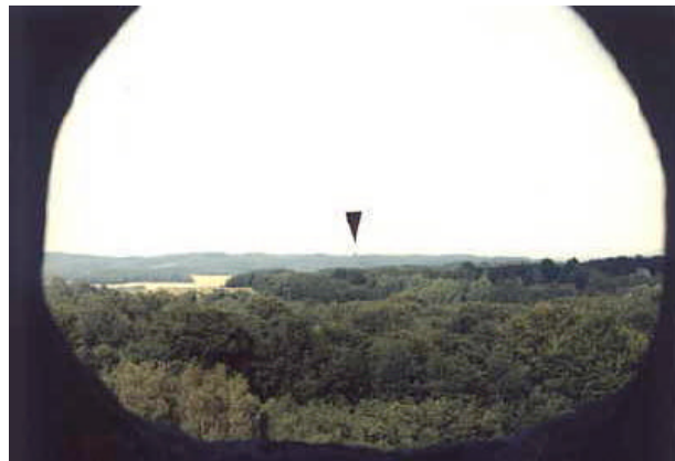
Links: Das Sazellum mit dem „Altar“. Rechts: Blick aus dem Sazellum-Fenster der Externsteine. In der Mitte am Horizont die Baumgruppe neben dem Ludrenplatz „Alte Haide“, zu dem wir eine Lichtverbindung schaffen wollten (Pfeil).

Schon 1927 hatte Wilhelm Teudt auf die „seltsamen Linien“, der Warttürme hingewiesen (3). Seine mühselige Kleinarbeit nützte jedoch nicht viel, seine Thesen wurden zugunsten der nationalsozialistischen Sache missbraucht, ausgeschlachtet und dann urplötzlich fallengelassen. Ungeachtet dessen hatte Teudt im Ansatz damit doch recht.