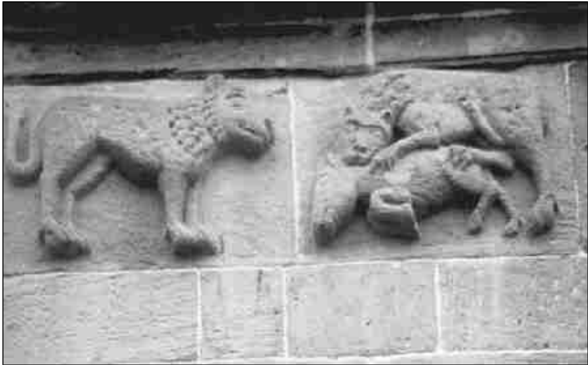
Ein Löwe schaut zu, wie ein anderer Löwe einen Eber bezwingt (Gestalten an der romanischen Abteikirche in Andlau im Elsaß)

Die enorme Bedeutung des Individuums im kosmischen Aspekt tritt hier klar zutage. Sie ist vermutlich erstmals von Zarathustra in dieser krassen Weise formuliert worden und hat sich in abgeschwächten Formen über ganz Westasien ausgebreitet, wobei auch Griechenland und Israel mitgeprägt wurden. Die eigentlichen Erben dieser persischen Religion waren die Patarener, Bogomilen, Paulikianer, Katharer, Waldenser, Albigenser ... – eine Bewegung, die unter verschiedenen Namen und gewiss nicht einheitlich vom 10. bis 14. Jahrhundert über Armenien und Bulgarien flutend Italien, Frankreich und Deutschland erreichte. Als stärkste und bestorganisierte Mission erwies sich die der Bogomilen (= "Gottesfreunde"), die in Bulgarien um 940 erstarkte und bald den ganzen Balkan und Norditalien ("Patarener") überzog. Ihnen sehr nahestehend und nur in einzelnen dogmatischen Punkten verschieden waren die Paulikianer aus Byzanz, deren Name allerdings nichts mit Paulus zu tun hat, sondern mit populo = Volk, weshalb sie richtiger auch Publikaner genannt wurden, ein Begriff, mit dem die katholische Kirche später zeitweise einfach alle Ketzer bezeichnete.