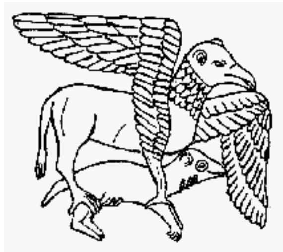
Geflügelter Greif packt ein Jungtier (Gestalten an der romanischen Abteikirche in Andlau im Elsaß)

Ravenna war die letzte weströmische Hauptstadt während der sogenannten Völkerwanderung. Der Ostgotenherrscher Theoderich d.Gr. ließ sich hier (angeblich um 520 AD) sein Grabmal erbauen, das noch deutlich die Stilmerkmale der Kurgane der Steppe trägt: Ein freistehender Rundbau mit einem enormen Deckstein als Krönung. Man hat das Gewicht des Decksteines auf 400 t geschätzt; aber auch wenn es weniger sind, ist doch der Aufwand ganz unverhältnismäßig und unrömisch, wenn man bedenkt, dass dieser Stein auf Schiffen von Istrien übers adriatische Meer herangeschafft worden sein soll. Das Gebäude selbst war fast völlig schmucklos. Die wenigen Kreuze können leicht als spätere Fälschungen enttarnt werden, wobei man die beachtliche Mühe erwähnen sollte, die bei einem der Kreuze aufgewandt wurde, um die Täuschung so perfekt wie möglich wirken zu lassen: Man hat (vielleicht im 16. Jahrhundert) einen wichtigen Stein aus einer Wand herausgebrochen und durch einen anderen mit reliefartigem Kreuz ersetzt; der Betrug fällt erst in jüngerer Zeit auf, da sich beim Senken des Bauwerks hier ein Riss gebildet hat, während die sonst einheitlichen übrigen Wände den Druck gut ausgehalten haben.