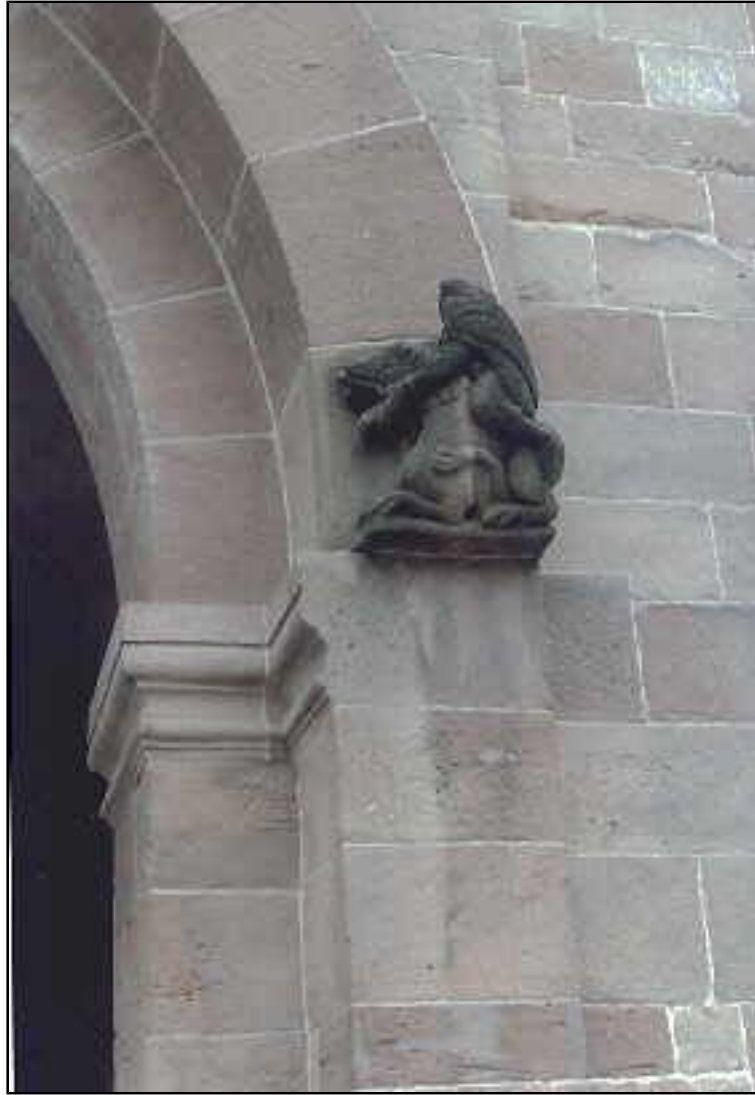
Kopflloser Mann bezwingt einen Löwen (Gestalten an der romanischen Abteikirche in Andlau im Elsaß)