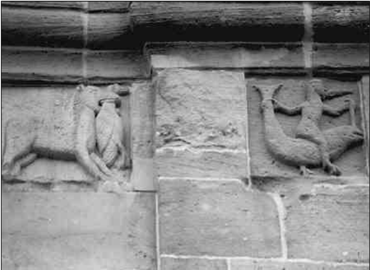
Wolf mit gefangener Gans und Frau reitet einen großen Fisch (Gestalten an der romanischen Abteikirche in Andlau im Elsaß)