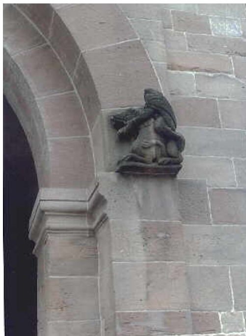
Kopflöser Mann bezwingt einen Löwen (Gestalten an der romanischen Abteikirche in Andlau im Elsaß)

Wir stellten uns die Frage: Was bedeuten die Skulpturen und Dachfiguren an den romanischen Kirchen? Welcher Geist spricht aus ihnen?