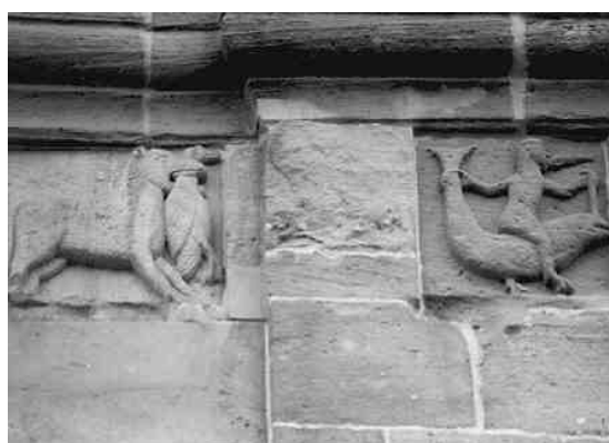
Wolf mit gefangener Gans und Frau reitet einen großen Fisch (Gestalten an der romanischen Abteikirche in Andlau im Elsaß)

Alle genannten geistigen Grundzüge jener Zeit in unserem Lebensraum sind unchristlich und lassen sich auf iranisch-turanische Wurzeln zurückführen. Erwähnt sei noch einmal, dass die einzige griechische Nennung der Germanen (bei Herodot) diesen Stamm im Iran sieht.