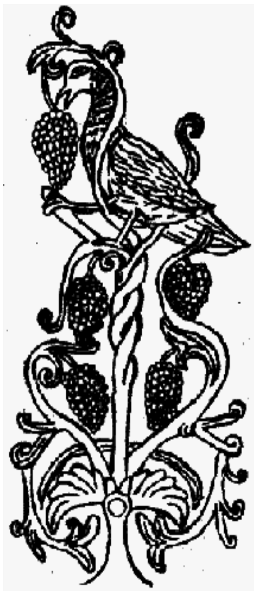
Ein Vogel pickt von den fünf Trauben des Lebensbaumes (Gestalten an der romanischen Abteikirche in Andlau im Elsaß)

Interessant ist nun das Wechselspiel dieser iranischen Geisteströmung mit den schon vorher vorhandenen religiösen Formen. Zunächst einmal können wir annehmen, dass die „germanischen“ Völker durch ihre lange Tradition im iranischen Einflussbereich schon im Steppengebiet eine eigene Verschmelzung geschaffen hatten, weshalb eine direkte Ableitung des romanischen Tierstils aus den sassanidischen Kunstwerken schwerfallen wird. Die zentralasiatische Komponente ist durchschlagend in vieler Hinsicht. Das fällt auch an den Grundrissen der ersten romanischen Kirchen auf, etwa an Sankt Maria im Kapitol in Köln, an der Karlskirche in Aachen, selbst an der Hagia Sophia in Byzanz: Rundbauten, wie sie aus dem Kult-Zelt und dem Kurgan entwickelt sind, grundverschieden von den Rechtecktempeln des Mittelmeers, die aus dem hölzernen Langhaus entstanden waren.