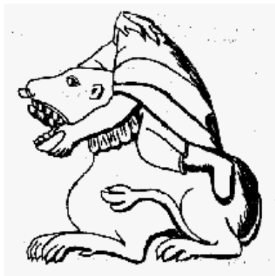
Kopflöser Mann bezwingt einen Löwen (Gestalten an der romanischen Abteikirche in Andlau im Elsaß)