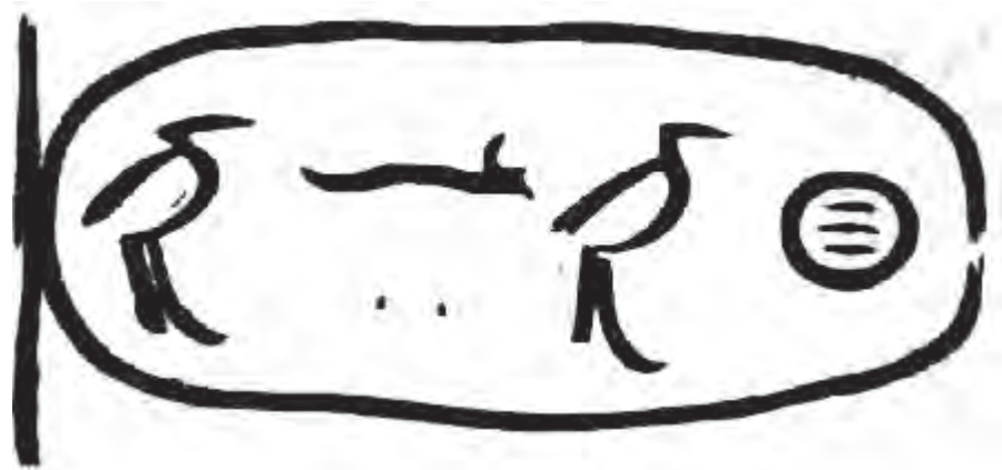
Die Cheops-Kartusche nach Lepsius (aus: Siliotti, S. 74)

Die Ausbildung zum Schreiber dauerte viele Jahre. Die Schüler lernten die Zeichen inklusive der Federführung auswendig, bei über 800 Zeichen im Alten Reich ein langwieriges Verfahren, zumal nicht nur die einzelnen Hieroglyphen, sondern auch komplette Worte und Texte auf diese Art erlernt wurden. War das erste Ziel erreicht, mussten die Schüler sich mit dem Erlernen des Hieratischen abmühen, was wiederum eine lange Zeit beanspruchte. Schätzungen gehen für einen Schreiber von einer Ausbildungszeit von bis zu zehn Jahren aus. Das mag verdeutlichen, wie lange es dauerte, schönes Schreiben zu erlernen. Ein Zimmermann oder Bauarbeiter musste nur eine, vielleicht zwei Markierungen so beherrschen, dass sie erkennbar waren. Auf zahlreichen Bauarbeitergraffiti, die z.B. an den Snofru-Pyramiden gefunden wurden, ist dieser Umstand noch heute gut zu erkennen, denn oft wirken die Inschriften wie von einer ungeübten Kinderhand gepinselt.