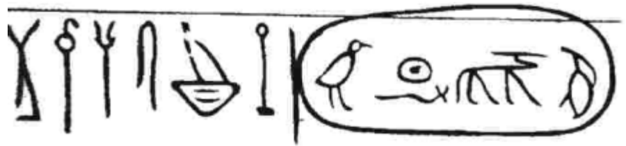
Abb. 1: Der vollständige Name des Cheops mit dem Namen des Bauarbeitertrupps (nach einer Zeichnung in Siliotti, S. 74, Bearbeitung: Prahl)

„Ganz sicherlich waren die Bauarbeiter und Steinmetzen keine ausgebildeten Schreiber.“