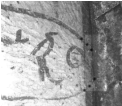
Zweimal dasselbe Foto der Cheopskartusche (um 90° gedreht). Im unteren Bild habe ich den Rand durch eine Vierteltonaufhellung verändert. Die Spalte ist ganz schwarz. Recht gut lässt sich erkennen, dass die Kartusche in die Wand hineinreicht und somit nicht gefälscht sein kann.

Hermann Ranke, der das bis heute maßgebliche dreibändige Lexikon „Die ägyptischen Personennamen“ verfasst hat [derzeit schreibt der Ägyptologe M. Müller, Uni Bonn, an seiner Dissertation, einer Zusammenstellung aller bekannten Namen des ägyptischen Alten Reichs], als auch Jürgen von Beckerath, der das ebenfalls maßgebliche „Handbuch der ägyptischen Königsnamen“ schrieb, noch der Verfasser des Nachschlagewerkes „Großes Handwörterbuch Ägyptisch Deutsch“, Rainer Hannig, einen Grund sehen, an der Datierung in die 3. Dynastie zu zweifeln, wie mir auch bei mehreren schriftlichen Anfragen durch diverse Ägyptologen weiterhin bestätigt wurde. Um eine derartige Datierung glaubwürdig anzweifeln zu können, wäre es eine Grundvoraussetzung, die Hieroglyphenschrift ausreichend zu beherrschen und sich in ägyptologischen kunsthistorischen und Textdatierungen auszukennen. Keine dieser Attribute treffen auf die Autoren (auf mich übrigens auch nicht) im hinrei-