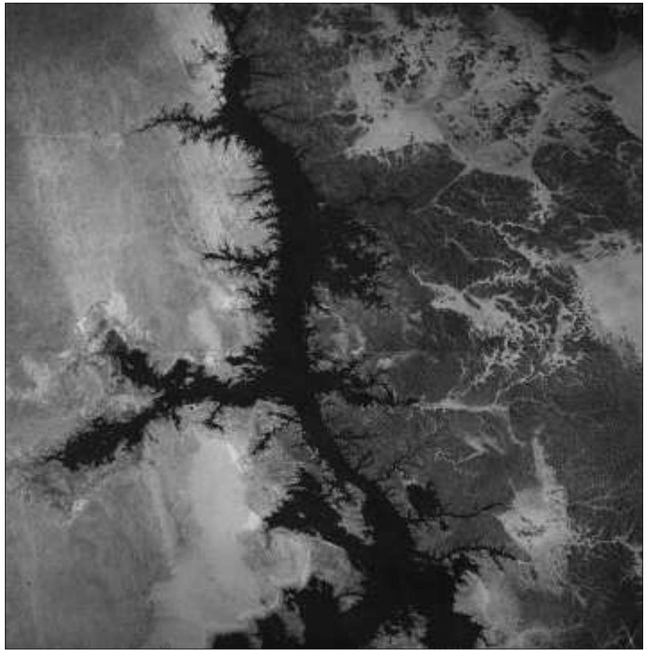
Das im Nasser-Stausee stehende Nilwasser hat die ehemaligen Zuläufe wieder sichtbar gemacht.

Eine Kettenreaktion breitet sich wie ein (unsichtbarer) Ballon aus, der sich kugelförmig aufbläht. Dabei wächst seine Oberfläche. Die Gesetze der Mathematik bedingen dabei, dass das sich ändernde Verhältnis zwischen der Kugeloberfläche und dem von dieser Kugel umschlossenen Volumen berücksichtigt werden muss. Mit wachsendem Volumen verkleinert sich das Verhältnis Ku-