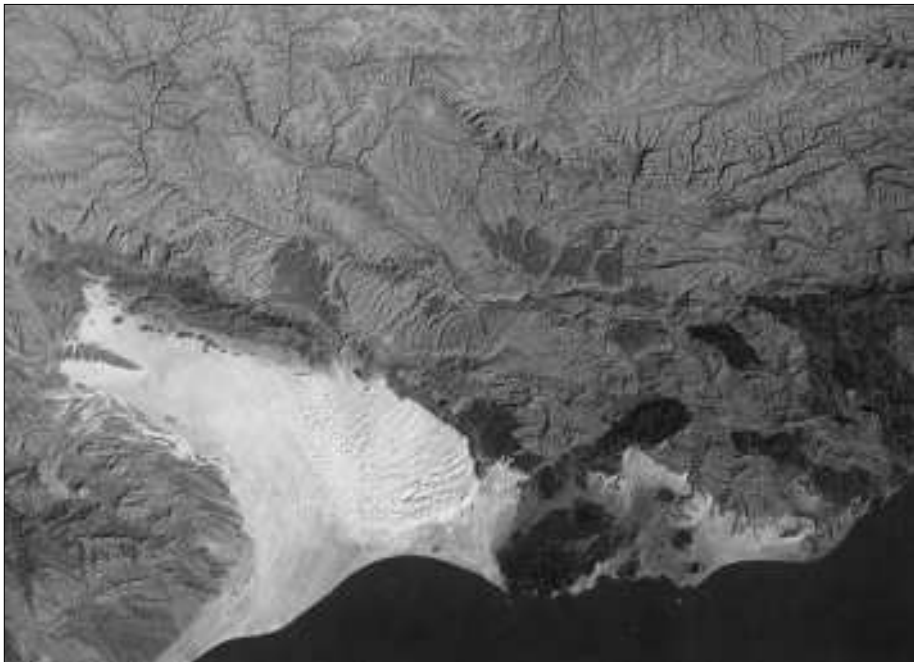
Die Hadramaut-Küste. Oben ist Norden, unten befindet sich das Arabische Meer.

Effekt, der besagt, dass die Umwandlung der durch die Explosion erzeugten Energie aus Elektronen in Lichtquanten einer derartigen Zerstreuung unterliegt, dass eine Kettenreaktion innerhalb der Lufthülle „abgelöscht“ wird, wenn der Durchmesser der „Reaktionskugel“ nicht größer als ca. 50 Meter wird. Da die Kugelschale, die wir uns als eine sich ausdehnende Flammfront vorzustellen haben, in keinem Falle eine „Wanddicke“ von 50 Meter übersteigt, kann tatsächlich mit der Ablöschung der Kettenreaktion im Sinne des Compton-Effektes gerechnet werden (sagt der Report LA-602). Der dennoch mit verschiedenen, äußerst bedenklichen Eventualitäten durchsetzte Befund endet schließlich im (Original-) Wortlaut: