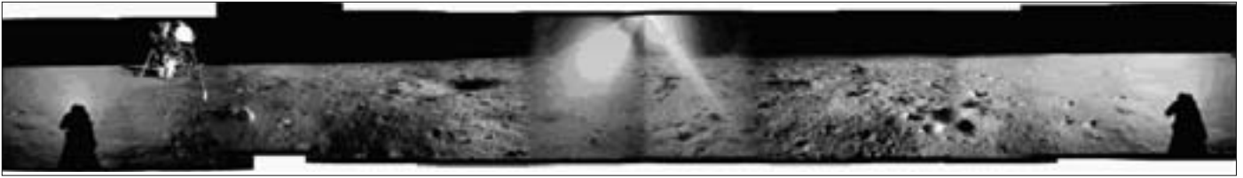
Panoramabild von APOLLO 11, zusammengesetzt aus Einzelbildern. Frage: Wo sind eigentlich die Berge geblieben, die um das Landegebiet vorhanden sein müssten?

Es gibt eine derart große Zahl von Widersprüchen, Falschaussagen und Unmöglichkeiten zum APOLLO-Projekt der bemannten Mondflüge in den sechziger Jahren des letzten Jahrhunderts, dass man mit Fug und Recht behaupten kann: Die APOLLO-Flüge zum Mond haben niemals stattgefunden! Ich habe die einzelnen Punkte in meinen beiden Büchern „Die dunkle Seite von APOLLO“ und „Die Schatten von APOLLO“ ausführlich dargelegt. Einer der Punkte, den ich hier etwas ausführlicher behandeln möchte, betrifft die Fotos, die uns als „Beweis“ von der NASA geliefert werden, dass amerikanische Astronauten unseren Mond betreten haben.