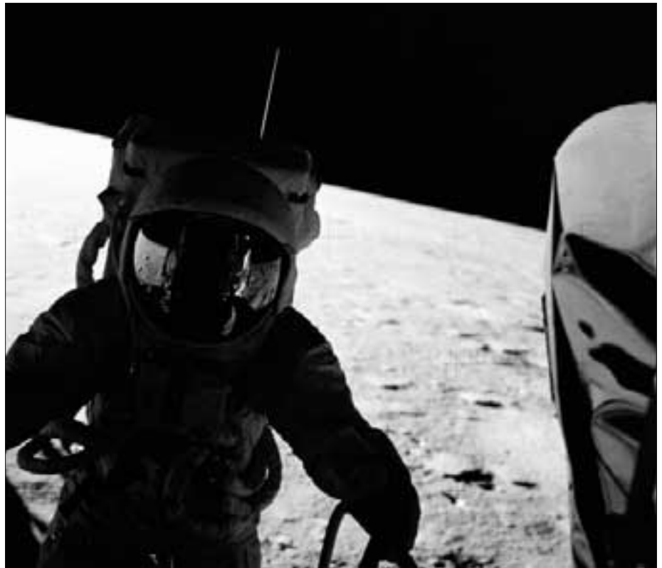
Pete Conrad von APOLLO 12: Wer hat ihn fotografiert? In seinem Helmvisier spiegelt sich kein Fotograf, sondern nur die Fähre!

wurde „auf Teufel komm raus“ fotografiert, ein Bild nach dem anderen, obwohl sich dabei die Landschaft kaum veränderte und zusätzlich die Videoaufzeichnung der TV-Kamera auf dem Rover existierte, die vom Kontrollzentrum in Houston ferngesteuert wurde. Unverständlich ist dieser Filmverbrauch schon, denn was wäre gewesen, wenn die Astronauten nach längerer Fahrt ein hochinteressantes Objekt gefunden hätten und es nicht fotografieren konnten, weil sie ihre Filme bereits während der stinklangweiligen Fahrt verbraucht hatten?