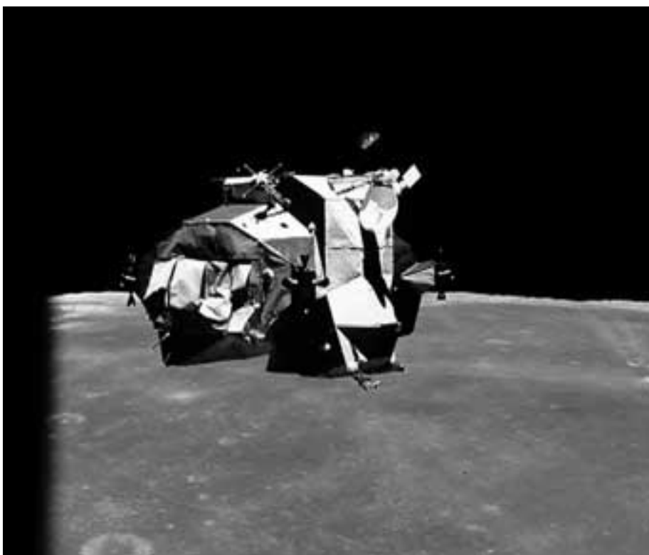
Die „von der Mondoberfläche“ zurückgestartete Retrokapsel von APOLLO 16 kurz vor dem Andockmanöver an das Servicemodul. Und uns will man weismachen, solch ein Trümmerhaufen sei raumflugtauglich!

arbeiter im technischen Bereich davon zu überzeugen, Schutzhandschuhe zu tragen. Bereits eine Hausfrau kann ein Lied davon singen, wie wenig man mit