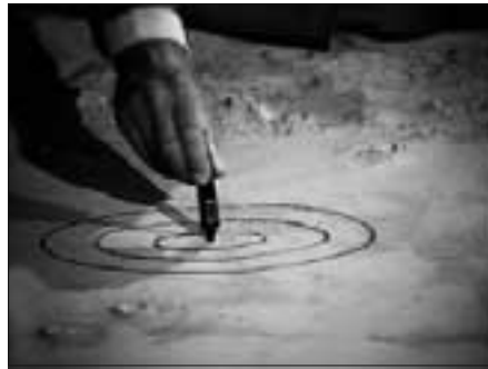
Im ARD-Studio während der Direktübertragung der Landung von APOLLO 11 hatte man ein Modell des Landegebietes angefertigt. Hier sind die umgebenden Berge - die auf den Fotos zu sehen sein müssten! - noch vorhanden.

Zunächst einmal müssen wir feststellen, dass in der Öffentlichkeit von den APOLLO-Missionen gerade mal rund ein paar Handvoll Fotos allgemein bekannt sind. Es sind die werbewirksam damals von der NASA an die Medien vergebenen Bilder. Tatsächlich gibt es jedoch mehr als 14.000 Fotos von den Missionen, und seltsamerweise werden es immer noch fast täglich mehr in den NASA-Internetz-Bildarchiven, sodass man sich langsam fragen muss, wo diese rund fünfunddreißig Jahre lang unerkant gelagert waren? Ich will der NASA nicht unterstellen, dass sie selbst heute noch nachträglich APOLLO-Fotos produziert, aber seltsam ist es doch.