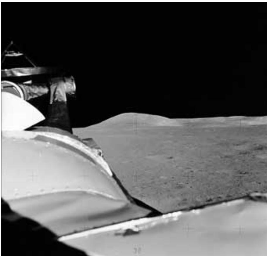
Wieso verwendete die NASA eigentlich Landefähren (hier von APOLLO 15), die bereits deutliche Roststellen zeigen?

Handschuhen bestimmte Tätigkeiten zumindest stark erschwert sind. Nicht umsonst haben Sicherheitsbeauftragte in Firmen ihre liebe Not, um ihre Mit-