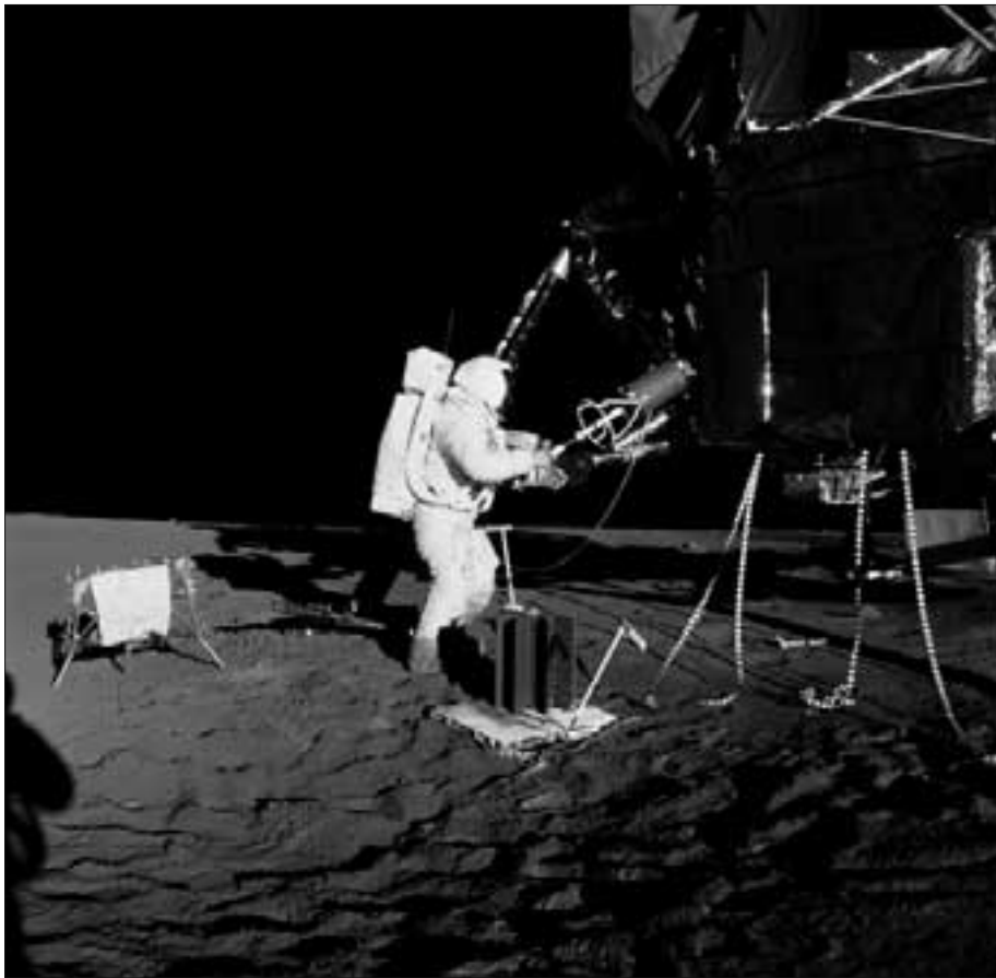
Nicht nur bei APOLLO 11, auch bei APOLLO 12 reicht der Schatten der Fähre bis zum Horizont, ein Zeichen dafür, wo die Halle zu Ende ist und die schwarze Hintergrundwand beginnt.