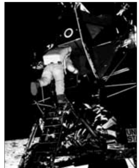
Ausstieg von Buzz Aldrin (APOLLO 11) aus der Fähre. Die Ausstiegsseite liegt im Schatten. Wieso ist Aldrin trotzdem so gut ausgeleuchtet?

„blind“ fotografieren, auf gut Glück, in der Hoffnung, das zu fotografierende Objekt getroffen zu haben. Das mag funktionieren, um eine Landschaft zu fotografieren, aber um nähere Objekte passgenau in der Bildmitte zu treffen, gehört schon eine gehörige Portion Glück dazu. Die NASA argumentiert hierzu, dass die Astronauten auf der Erde monatelang das Fotografieren in dieser Art trainiert hätten. Gut, mag sein. Verdächtig ist es allemal, wenn gut platzierte Gegenstände (oder der jeweils andere Astronaut) bildmittig fotografiert sind, ohne dass im Filmmagazin mehrere „verfuschte“ Bilder vorhanden sind. Von der Logik her würde ich ein Objekt, das ich fotografieren will und nur gefühlsmäßig anpeilen kann, mehrfach fotografieren, dabei die Kamerarichtung immer etwas verändernd, in der Hoffnung, dabei wenigstens ein gut getroffenes Bild zu erhalten. Und ohne Objektpeilung ein Foto zu machen, auf dem (von unten nach oben fotografiert) die Erdkugel über dem Fahnenmast der