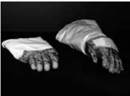
Die Handschuhe eines APOLLO-Raumanzuges. Links der Innenhandschuh, rechts der Überhandschuh. Dass man damit keine feinmotorischen Arbeiten verrichten konnte, liegt wohl auf der Hand.

Verblüffend ist auch die Menge der (bisher) bekannten APOLLO-Fotos. Als Beispiel sei hier APOLLO 11 genannt. Die beiden Astronauten Neil Armstrong und Buzz Aldrin befanden sich gerade mal rund zwei Stunden „auf dem Mond“ (einschließlich der Zeit in der Fähre), doch in diesem kurzen Zeitraum hatten sie knapp 600 (sechshundert!) Fotos gemacht. Schaffen Sie das in dieser Zeit, so ganz nebenbei während Ihrer Arbeit? Denn Filmwechsel gehören ja auch noch dazu. Man hat fast den Eindruck, dass die Astronauten die ganze Zeit immer nur den Finger am Auslöser hatten – obwohl sie doch eigentlich mit anderen Dingen beschäftigt waren und nur eine begrenzte Zeit zur Verfügung stand. Sie sammelten schließlich laufend irgendwelches Gestein ein, waren mit Gerätschaften beschäftigt oder fuhren (ab Mission 15) mit dem Mondrover durch die Gegend. Doch auch während der Roverfahrten