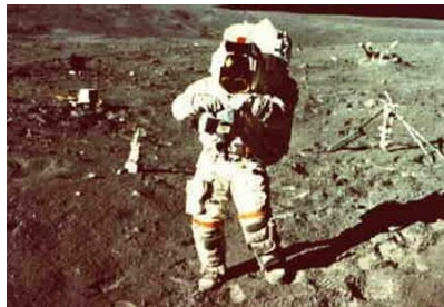
Filmwechsel im „Freien“ (APOLLO 16)