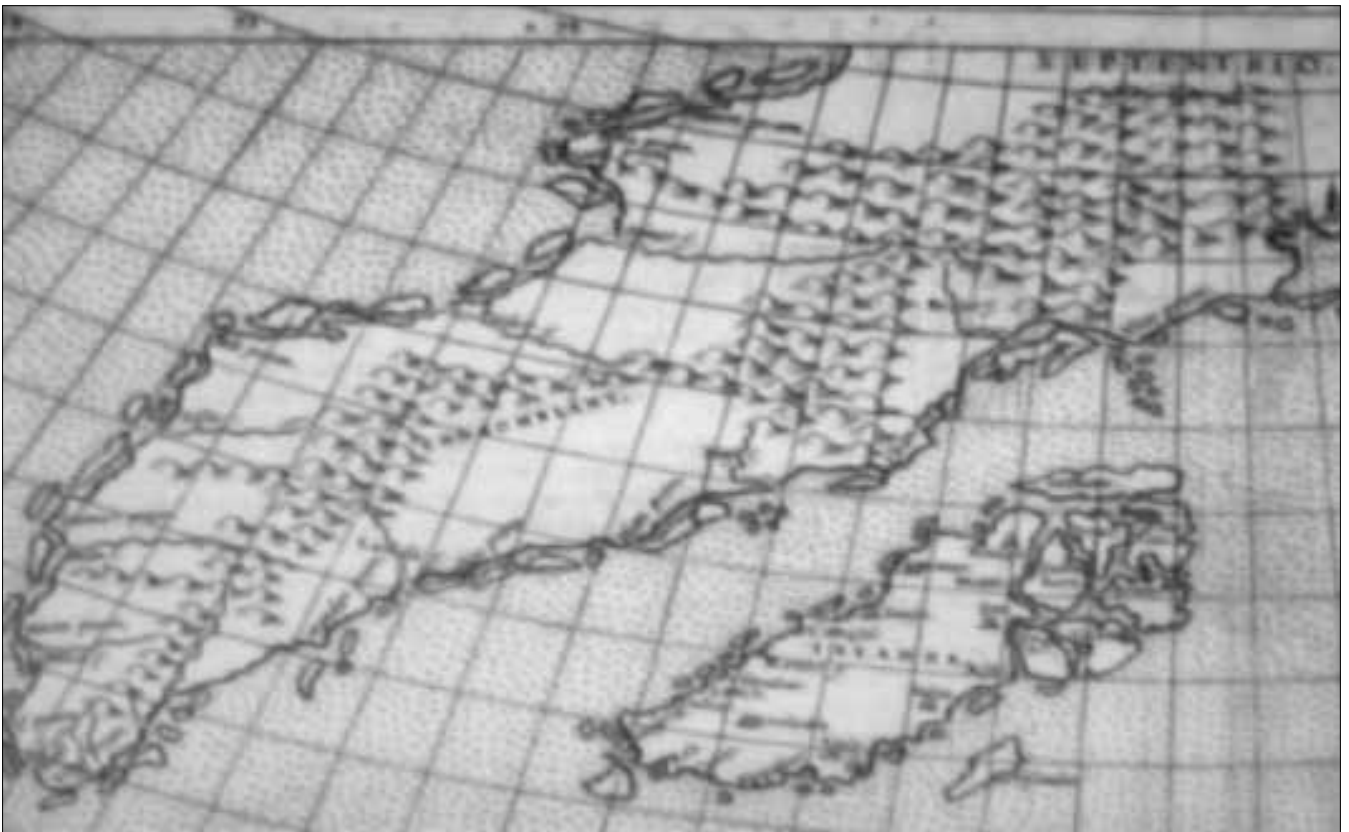
Karte von N. u. A. Zeno 1380, vom eisfreien Grönland in einer Polarprojektion. Zu sehen sind nicht nur genauer Küstenverlauf mit Inseln, auch Gebirgszüge und sogar benannte Flüsse und Ortschaften. Die heutige „Eismitte“ befindet sich laut dieser Karte mitten im Zentralgebirge, das - laut obigen Angaben von NGRIP - eisfrei anscheinend höchstens nur 62 m über dem Meeresspiegel aufragt ... (aus „Kontra Evolution“ von H.-J. Zillmer).

Eines Tages tauchte jedenfalls im SYNESIS-Magazin Nr. 6/2011 in einem bemerkenswerten Bericht von Jochen Herzog über „deutsche Megalithbauten an Berghängen“ (u. a. über die Forschungsarbeit von W. Haug) ein Diagramm über den Salpetereintrag eines Eisbohrkernes aus „der Polarregion“ auf, das mich sofort elektrisierte. Weltweite Kataklysmen, die