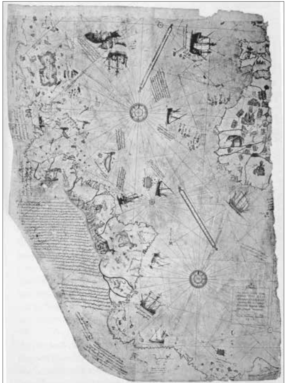
Karte einer mit Südamerika verbundenen Antarktis von Piri Re'is, 1513. Rechts oben Spanien/Portugal und Westafrika. Diese Karte entspricht in etwa der Karte rechts. (Aus „Im Namen von Zeus“ von EvD)

Zu allem hin existieren interessanterweise dazu noch alte Karten - Portolane genannt - z. B. von N. u. a. Zeno, 1380 von Grönland (= Grünland!), und des Piri Re'is 1513 und des Philippe Buache 1737 von der offiziell erst 1818 entdeckten Antarktis. Alle diese Portolane sind Kopien „antiker“ Karten, die deutlich zeigen, dass jedenfalls irgendwann vor der „Kleinen Eiszeit“ um ca. 1350 diese