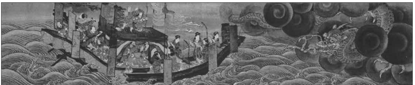
Japanische Darstellung einer Apokalypse (Ausschnitt): aus dem großen Epos Heiji-monogatari-emaki.

Deshalb handelt es sich also um „Polareis“, das jedenfalls erst nach den letzten schweren (kosmischen) Katastrophen, z. B. im „-8. Jhd.“ (n. I. V.) entstand, die u. a. zu einer Umkehrung des Magnetfeldes der Erde führten (n. W. H.). Höchstwahrscheinlich ist das Poleis aber erst nach der „Antike“, aus der ja angeblich die Originale der oben gezeigten