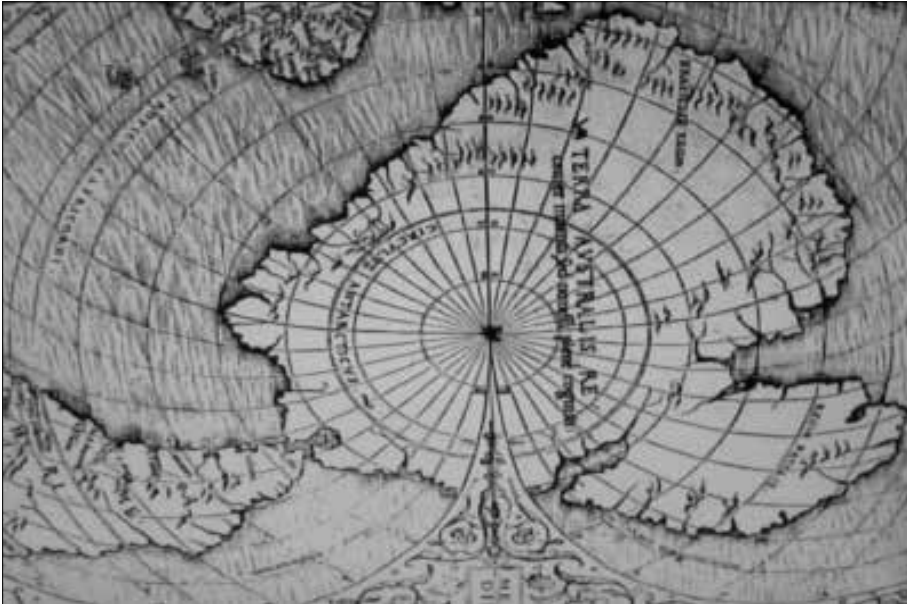
Oranteus Finaeus Karte von 1531 in Polarprojektion aus dem Mercator-Atlas von Gerhard Kremers 1569, in dem auf mehreren Karten die Antarktis dargestellt wurde, hier mit den Südspitzen von Südamerika und Afrika, genauem Küstenverlauf, Gebirgszügen und Flüssen. (Aus „Kontra Evolution“ von H.-J. Zillmer)

Karten stammen, vor etwa -1010 Jahren (n. C. M.) entstanden, taut aber seitdem langsam wieder ab. Nicht nur H.-J. Zillmer schreibt: „Nach den Erdkatastrophen begann die Phase des abtauenden Eises, die bis zum heutigen Tage anhält ...“