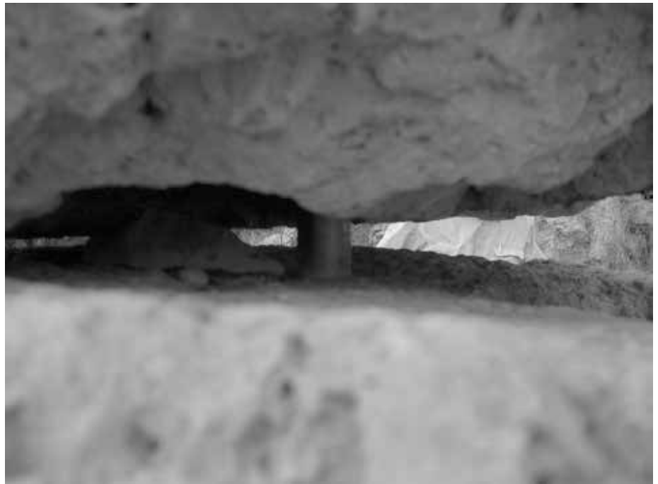
Die mittlere Metallstange soll verhindern, dass die aufgesetzten Blöcke herunter fallen.

Der nächste Einsatz an der Fundstätte fand hundert Jahre nach der Entdeckung des Heiligtums statt. Im Jahr 1995 erwarb dann die Gemeinde Costitx das Grundstück, auf dem sich die Fundstätte befindet, und man startete eine Aktion zur Ausgrabung und Wiederherstellung, die von Dr. Rosselló