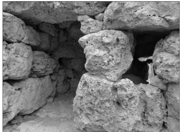
De Son Fred: Der Zugang (links von außen, rechts von innen).