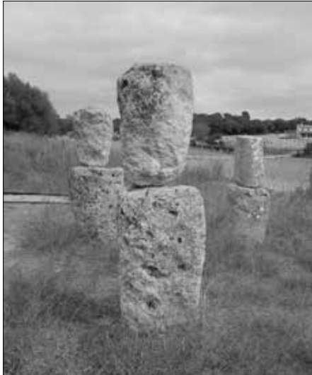
Ein anderer der „Tambouren“.

Ausgrabung durch, in dessen Verlauf verschiedene archäologische Funde dokumentiert und geborgen werden konnten. Man machte eine Planimetrie und verschiedene Höhenaufrisse des Heiligtums, durch die man den Verlauf der Mauern und die Standorte von dreizehn Tambouren oder monolithischen Säulen mit zylindrischer Tendenz und einem Durchmesser von etwa 55-75 cm dokumentierte.