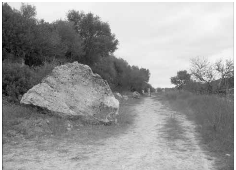
Der Zugangsweg zum Heiligtum im Hintergrund. Der Felsblock im Vordergrund hat wohl nichts damit zu tun.

den Komplex zwei halbrunde Schienen in der Erde versenkt.