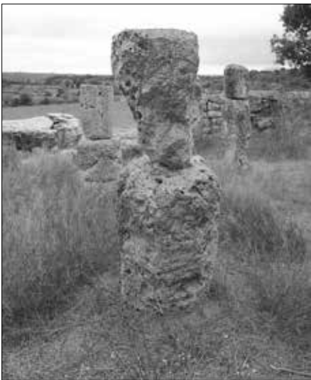
Einer der „Tambouren“.

Umbauarbeiten einer Trockensteinmauer zur Vergrößerung der Anbaufläche des in der Nähe befindlichen Bauernhofs neben anderen archäologischen Materialien drei Stierköpfe aus Bronze auf. Dank ihrer wird dieser Fundstätte große Bedeutung beigemessen. Der damalige Direktor des Museu Arqueològic Lul-lià, Bartomeu Ferrà , führte eine