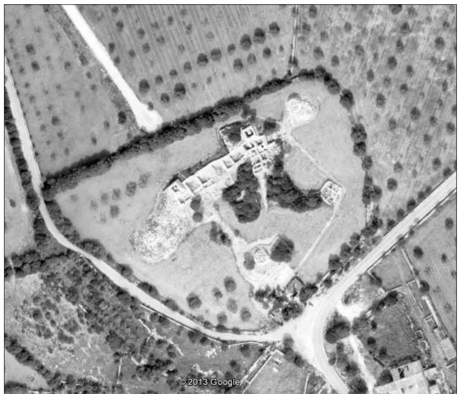
Über Google Earth kann man sich die Anlage Capocorb Vell von oben betrachten.