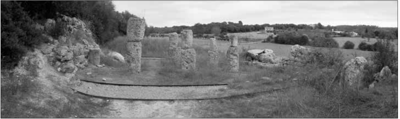
Panoramabild der Anlage. Um den Platz hat man malerisch halbkreisförmig Schienen verlegt.

welchen Kulthandlungen zu fröhen. Demzufolge konnten die ergrabenen Hausreste auch keine normalen Behausungen sein, sondern mutierten zu einem „Heiligtum“.