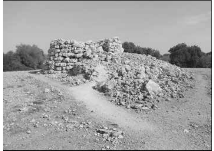
Capocorb Vell: Links und rechts: Je einer der eckigen Türme.