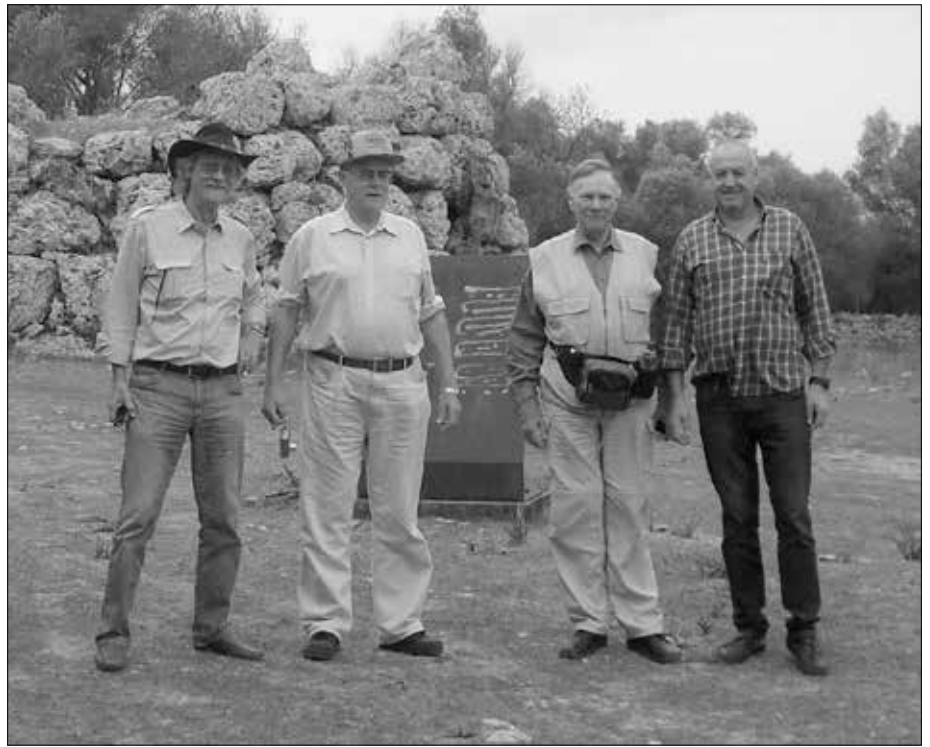
De Son Fred: Das EFODON-Team mit unserem Taxifahrer (rechts), der uns überall hin fuhr.

Die als Behausungen bezeichneten Räume (wir haben sie nicht nachgezählt) bieten jedoch in ihrer Ausführung – grobe, kaum bearbeitete Natursteinbrocken – kaum mehr als