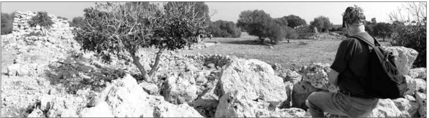
Panoramabild: Blick von dem zusammengefallenen Turm in Richtung eckiger Turm.

Ähnliche Bauwerke entstanden während des Talayotikums auch auf Korsika, Sardinien und Pantelleria. Einige Forscher nehmen deshalb an, dass zwischen den damaligen Kulturen des westlichen Mittelmeeres eine Verbindung bestand. Bei der Kultur des Talayotikums handelt es sich um eine weitestgehend eigenständige, nachvollziehbare Entwicklung der Balearischen Inseln, wobei Verbindungen zu anderen Kulturen nicht ausgeschlossen sind. Mehr oder weniger willkürlich hat man die Zeit des Talayotikums in verschiedene Epochen unterteilt. Das erinnert an die zeitlichen Unterteilungen in Ägypten, wohl um die geschichtlichen Abläufe in ein Raster einordnen zu können.