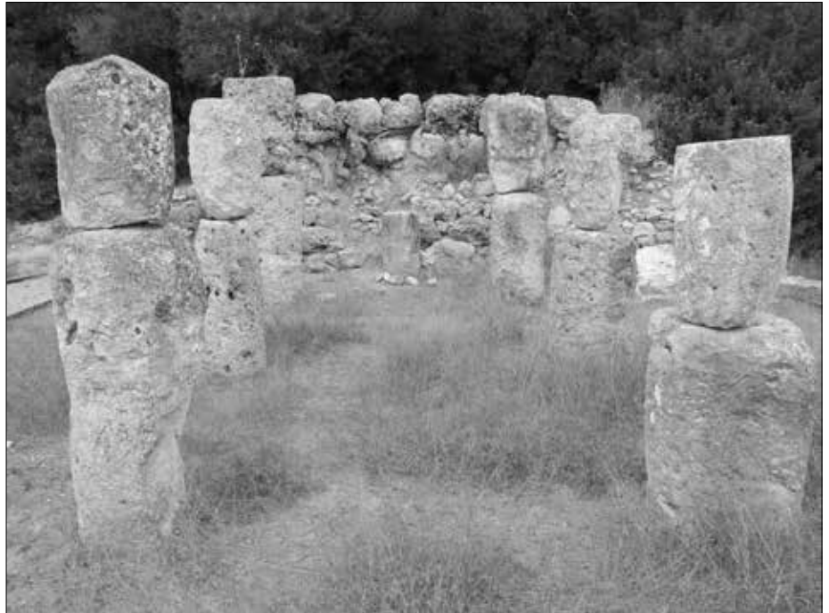
Die zwei Reihen „Tambouren“ sollen angeblich einst Deckplatten gestützt haben.

Das Heiligtum von Son Corró ist seit 1895 bekannt. Damals tauchten bei