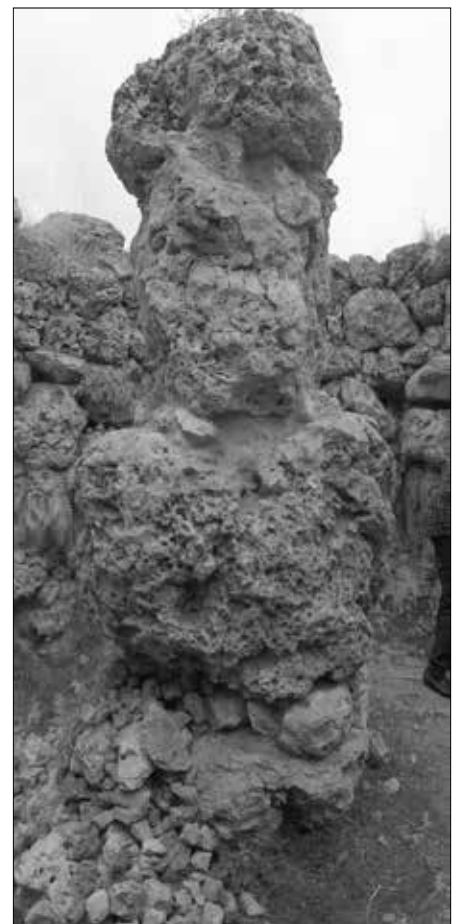
De Son Fred: Die Mittelsäule.

Als Besonderheit ist die riesige Säule anzusehen, die im runden Inneren des Talayots steht. Sie wurde – wie der Rest des Talayots – aus unbearbeiteten Steinblöcken zusammengefügt und ist – wie dieser – arg verwittert. Man könnte sich vorstellen, dass diese Mittelsäule einst als Stütze für eine steinerne Überdachung diente, was jedoch kaum noch zu rekonstruieren wäre. Gesetzt den Fall, dass über dieser Säule eine Über-