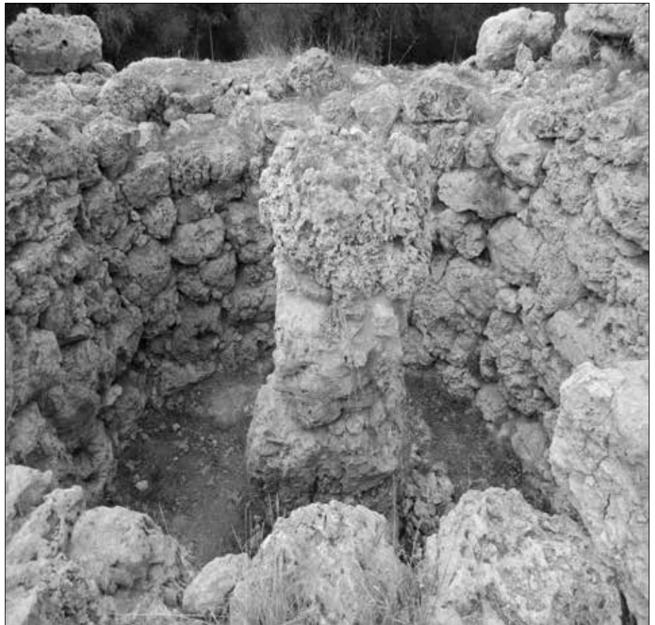
Talayot De Son Fred: Blick von oben auf die Mittelsäule. Handelte es sich hier etwa um einen vorgeschichtlichen Fruchtbarkeitskult?

Hierbei handelt es sich um keine Anlage wie bei Capocorb Vell, sondern nur um einen einzeln dastehenden Turm mit kreisförmigem Grundriss, bei einer Höhe von gut fünf Metern. Heute existieren noch vier bis fünf Lagen der