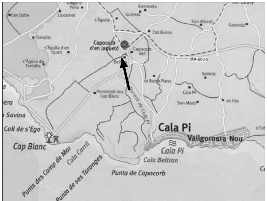
Übersichtskarte der Südküste mit dem Standort des Talayots Capocorb Vell (Pfeil).

Auf Mallorca werden ihre vereinzelt anzutreffenden größeren Siedlungen auch Clapers de gegants (Steingelände der Riesen) genannt.