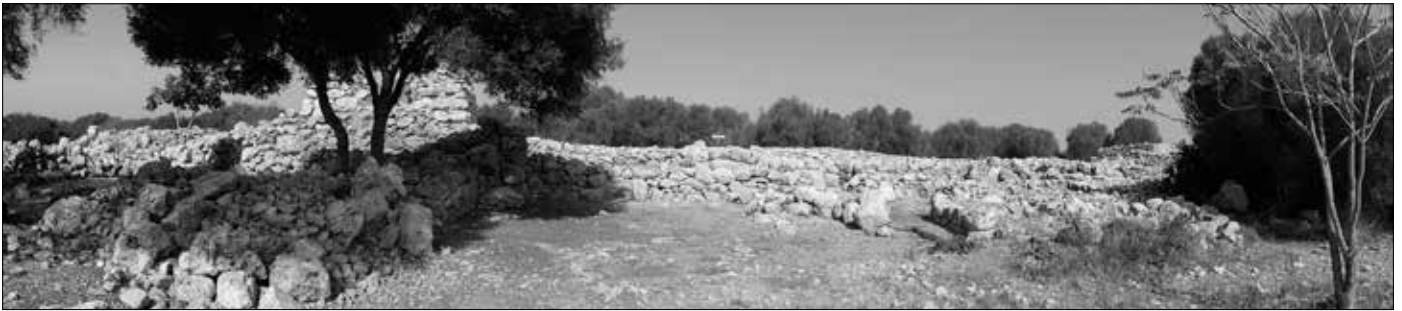
Capocorb Vell: Die Panoramabilder von links nach rechts: Zunächst der Zugangsweg, dahinter links ein zusammengefallener Turm, verbunden durch ein Mäuerchen mit einem der eckigen Türme, daran anschließend die dachlosen Bauten und ganz rechts (unten) einen der Rundtürme.