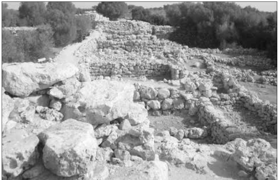
Capocorb Vell: (oben) In diesen labyrinthähnlichen dachlosen Bauten sollen einst rund 500 Menschen gelebt haben. Blick von einem der Türme auf die rekonstruierten Hausanlagen. Unten: Blick von oben in einen der Räume.