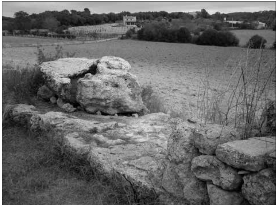
Überreste von angeblichen Gebäuden am Rande des Heiligtums.

Bordoy geleitet wurde. Diese bestand darin, die Tambouren, die von B. Ferrà dokumentiert worden waren, wieder instand zu setzen. Dr. Rosselló Bordoy deutete das Heiligtum als ein Gebäude mit einer ehemaligen Bedachung, die von sechs Säulen, die in zwei Dreierreihen senkrecht zum Eingang standen, gehalten wurde. Entsprechend wurden die Tambouren in die Position gebracht, in der man sie heutzutage sehen kann. Dieser Eingriff war ziemlich umstritten, da viele Forscher der Meinung waren, es