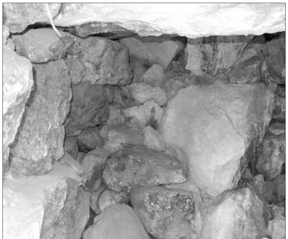
Das unspektakuläre Innere des Hohlraums.