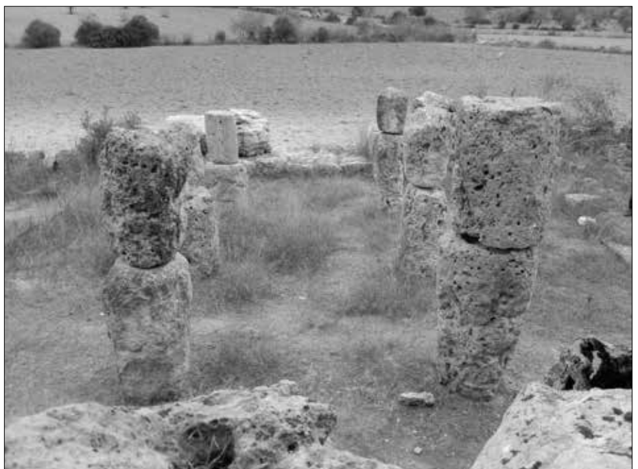
Blick von der anderen Seite auf die „Tambouren“.

Umbauarbeiten einer Trockensteinmauer zur Vergrößerung der Anbaufläche des in der Nähe befindlichen Bauernhofs neben anderen archäologischen Materialien drei Stierköpfe aus Bronze auf. Dank ihrer wird dieser Fundstätte große Bedeutung beigemessen. Der damalige Direktor des Museu Arqueològic Lul-lià, Bartomeu Ferrà , führte eine