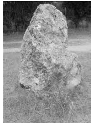
De Son Fred: Links und Mitte: Die Mittelsäule im Inneren des Talayots. Rechts: Der „Fersenstein“.