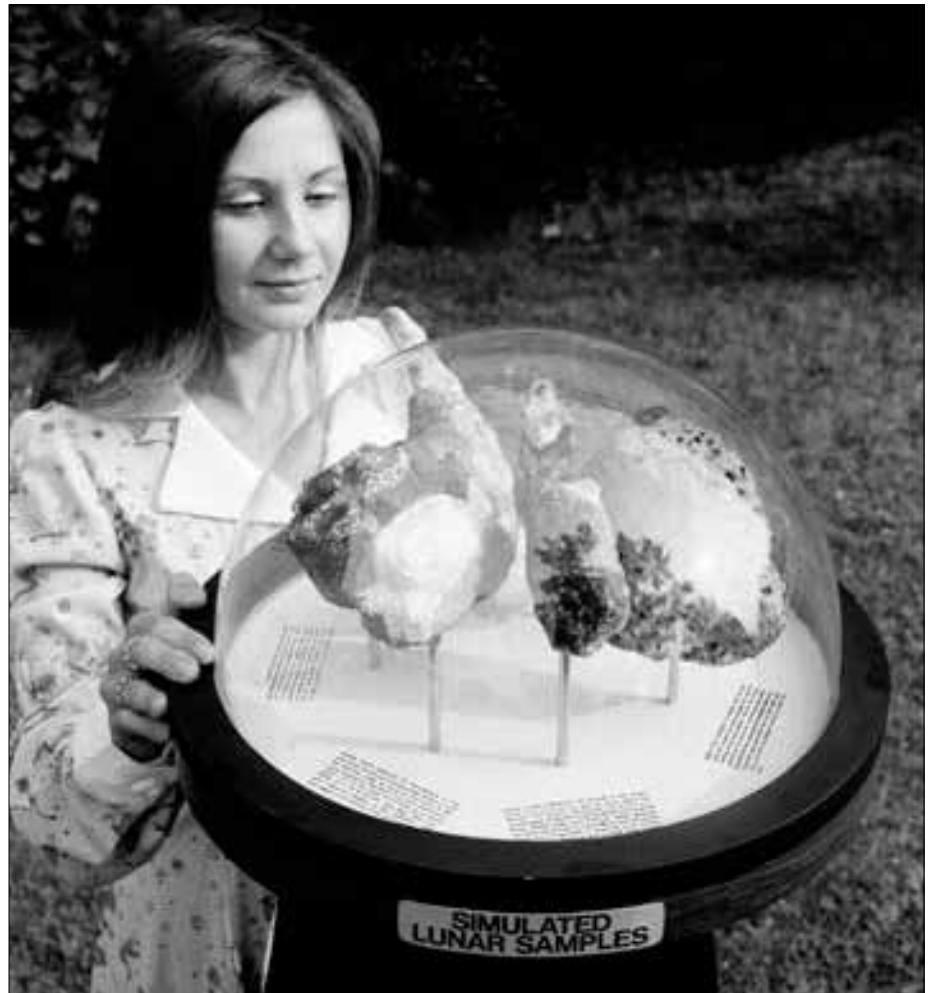
Simuliertes Mondgestein der NASA – verblüffend echt nachgemacht! (NASA-Bild-Nr. 00b68c20)

Der Mond gilt gemäss der Theorie des „Giant Impact“ als Produkt einer