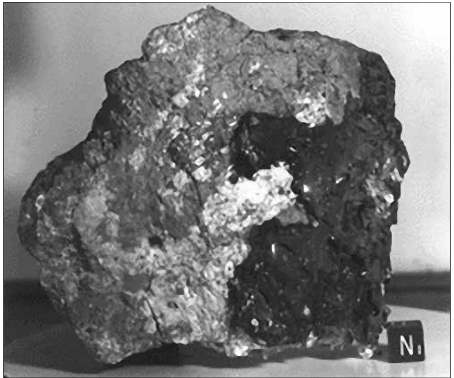
Ein angeblicher ein Kilogramm schwerer Mondfelsbrocken, der von Apollo 16 vom Mond mitgebracht worden sein soll. (NASA-Bildnummer as16-64435)

Durch die Apollomissionen in den sechziger und siebziger Jahren wurden angeblich mehrere hundert Kilogramm Original-Mondgestein auf die Erde gebracht. Sie werden von der NASA nur in geringsten Mengen an Forscher herausgegeben. Zuletzt in den Neunziger Jahren des letzten Jahrhunderts produzierte die NASA daher 25 Tonnen simulierten Staub, der allerdings inzwischen ausgegangen ist. Dieser Staub bestand hauptsächlich aus basalhaltigem vulkanischem Gestein. Da damit die komplizierte chemische und mineralogische Struktur des Mondstaubs jedoch nur andeutungsweise nachgeahmt werden konnte, versuchte die NASA nun, diese