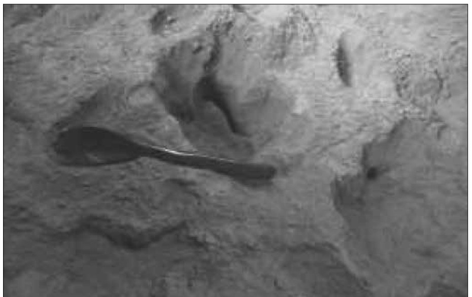
Simuliertes chinesisches Mondgestein (incl. Löffel!) („The Development of CAS-1 Lunar Soil Simulant“, International Lunar Conference 2005)

durch Mischen verschiedener Minerale aus mehreren Regionen der Erde zu imitieren.